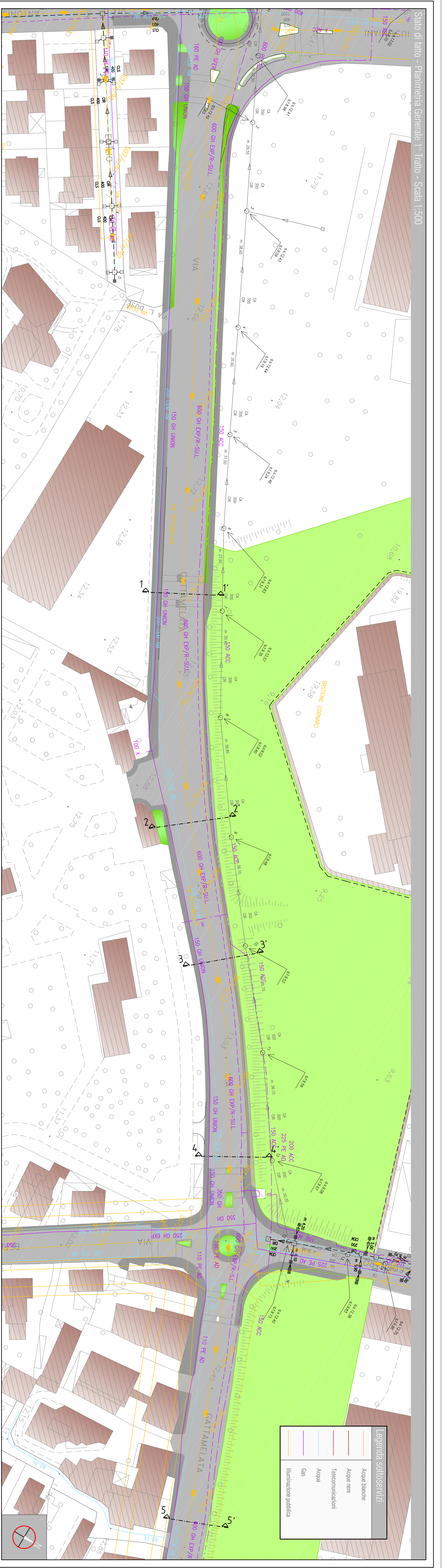
Stato di fatto - Planimetria Generale 1° Tratto - Scala 1:500