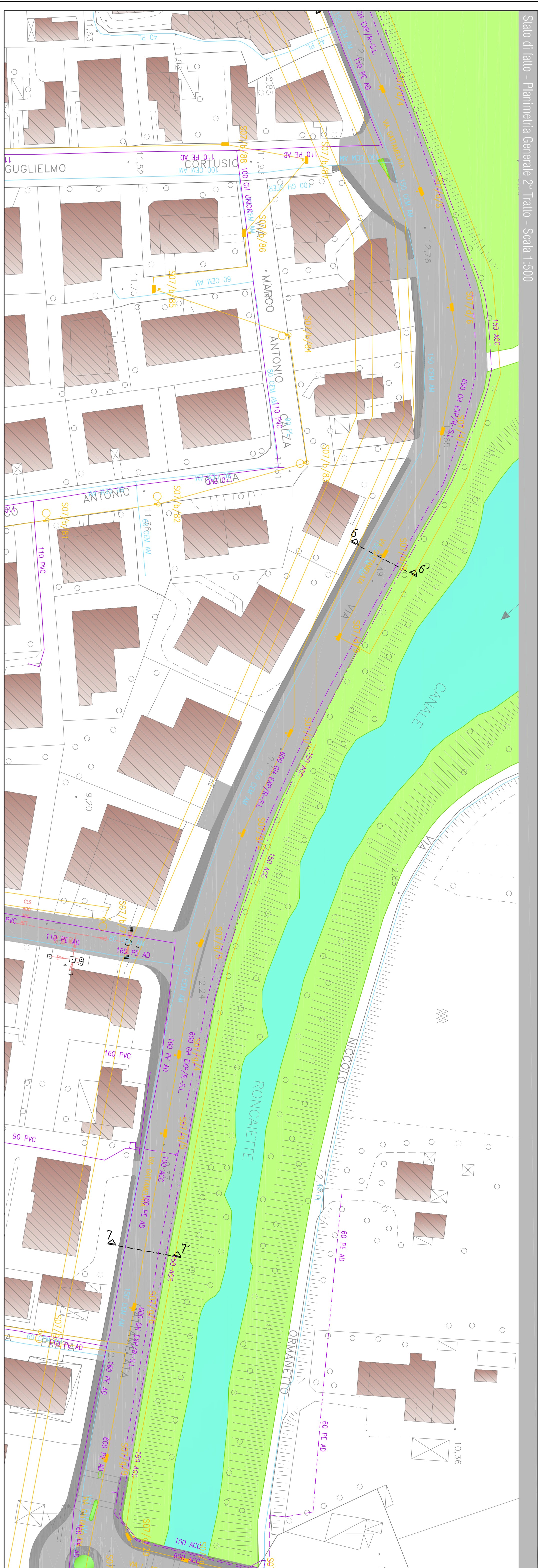
Stato di fatto - Planimetria Generale 2° Tratto - Scala 1:500